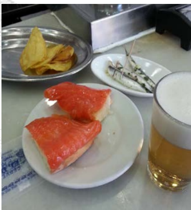
Canapé de Salmón en El Doble

Segunda parada: Ya en la calle Ponzano, el primero es un clásico. El Doble (Ponzano 17-19) . Cerveza bien tirada (1,5€ la caña y 2,5€ el doble) y con su tapa. La especialidad son los boquerones en vinagre con unas buenas patatas fritas (9€). Los canapés también están bien buenos (3,3€).