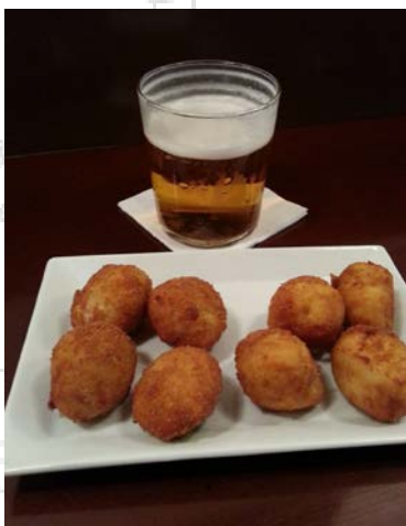
Perlas de ibérico (croquetas) en El Gordo y Flaco

Una muy buena alternativa, por si el Fide está hasta arriba, es el Gordo y Flaco (Bretón de los Herreros 13) . Es más un restaurante pero tienen una pequeña zona de barra donde te sirven unas croquetas muy buenas. Las llaman perlas de ibéricos, de setas y de ropa vieja (6€). Nuestras preferidas son las de ibéricos pero te pueden sacar un mix. También muy bueno el risotto de boletus (9€).