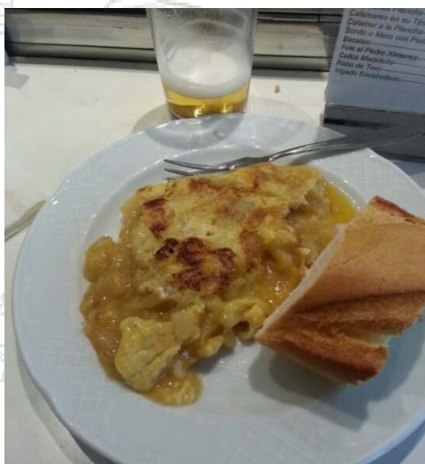
Pincho de Tortilla en Sylkar

Sexta Parada: Y una de las mejoras paradas para el final. Bajando por la calle Espronceda se llega a Sylkar (Espronceda 17) uno de los mayores referentes de la zona. Es obligado probar la tortilla de patatas por ser una de las más valoradas de Madrid (pincho a 2,9€). También muy recomendables la ensaladilla y los callos (eso sí 10 € media ración pero bien generosa). Todo bien acompañado de buenos vinos (copa Ribera joven 2,6€). Es importante destacar que cierra sábados noche y domingos.