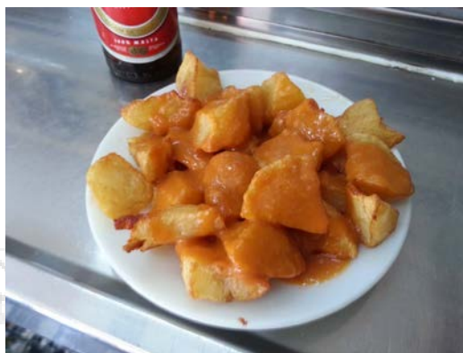
Bravas en La Ardosa

Primera parada: Bodega de La Ardosa (Santa Engracia 70) . Fundada en 1892 es una reliquia que hay que visitar. En su página web www.laardosa.com tenéis un montón de información acerca de sus orígenes y los diferentes dueños y familias que la han regentado, así como su oferta actual y especialidades. La fachada de azulejo es realmente bonita. Tenéis raciones variadas pero yo recomiendo probar la ración de bravas (3€) y una copa de vino (1.2€) o ración de bravas y mini de cerveza (5€). El botellín de Águila (1.5€) sale caro.