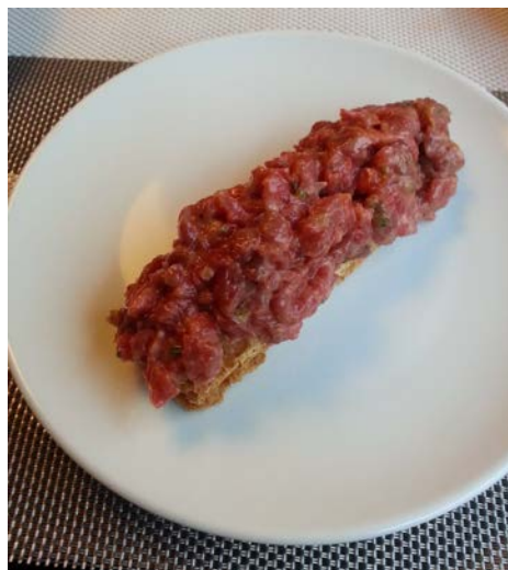
Pincho de Steak Tartare en La Máquina de Chamberí

... y si la cosa se anima: Un sitio de copas baratas y buen ambiente es Elcano Tavern (Alonso Cano 57) que queda muy cerca de ambos sitios de la última parada. Gran variedad de ginebras, poca de vodkas.