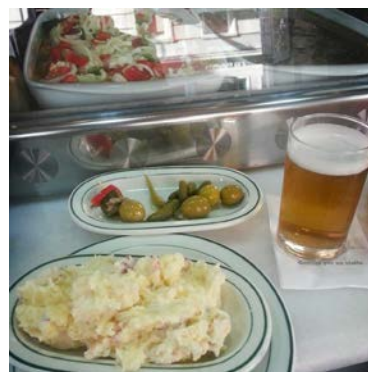
Media ración de ensaladilla con gambas y pulpo en FIDE

Cuarta parada: En la siguiente manzana nos encontramos un par de sitios muy buenos. Por un lado está la cervecería marisquería Fide (esquina de Ponzano con Bretón de los Herreros) . Todo un lujo. Las cañas bien frías (1,5€ la caña, 2,5€ el doble y 3€ la jarra) y buenos vinos desde 2,4€ la copa. Siempre acompañado de su tapa. Recomendamos acompañarlas con una media ración de ensaladilla rusa con gambas y pulpo (8€) o la ración entera (15€). A 15€ tienes raciones buenísimas de salpicón, berberechos al vapor, cigalas, gambas al ajillo, etc. También tienen buena variedad de conservas, raciones, canapés (3€) y embutidos ibéricos.